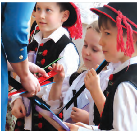
Czekolada i odblaski za występy.

Burmistrz Korcz, składając życzenia seniorom prosił, by dbali o siebie i koniecznie nosili po zmroku odblaski. Przyniósł w prezencie, jak się wyraził, małe kawałki plastiku, które mogą uratować życie. Odblasków wystarczyło dla wszystkich obecnych i dla członków ich rodzin oraz dla dzieci z Przedszkola nr 5, które przyszły na wigilijkę z kołędą i życzeniami. Najmłodszy mieszkańcy Lipowca śpiewali i recytowali dla najstarszych. Potem składano sobie życzenia, łamano się opłatkiem, wspólnie zjedzono obiad i deser, przygotowany przez panie z KGW. (mm)