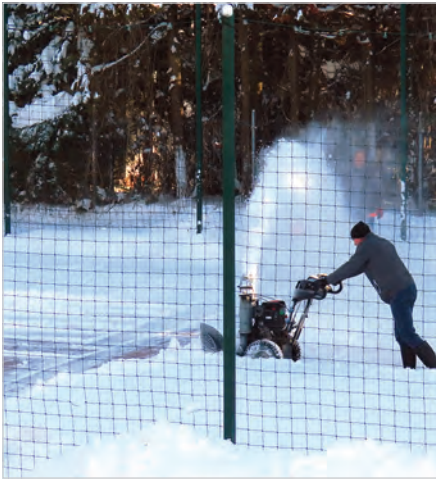
Tak powstawało lodowisko.