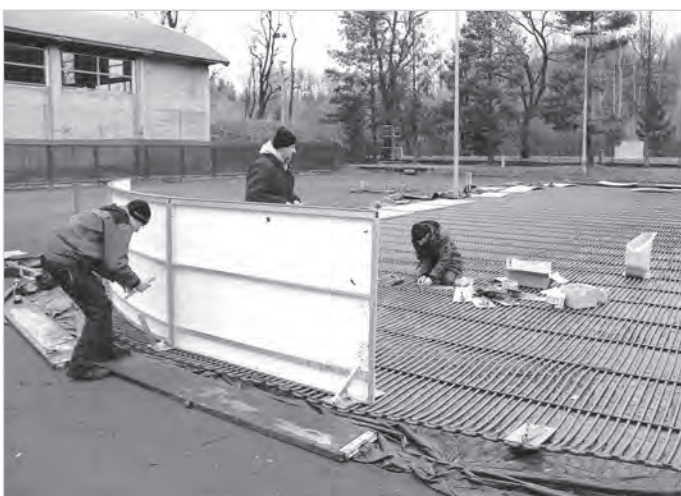
Nie taki dawny Ustroń 2015 r.