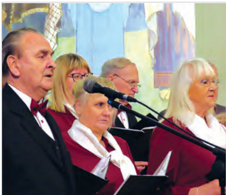
Koncert Chóru „Ave” i Dziecięcego Chóru „Trallala”.