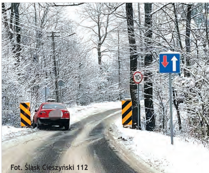
Fot. Śląsk Cieszyński 112