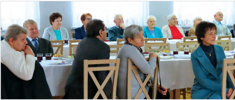
Tradycyjna wigilijka seniorów w Lipowcu.