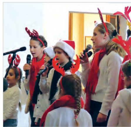
Koncert chóru „Eden”, zespołu SDG, Ustońskiego Chóru Ewangelickiego, Orkiestry Dętej Glorietta i chóru „Joy”.