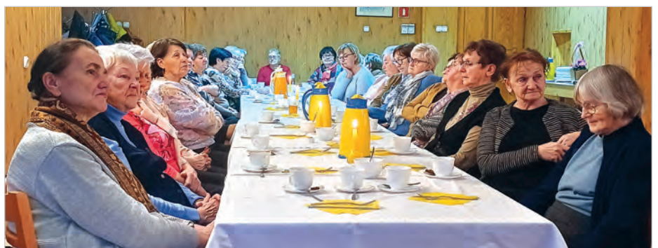
Planowanie pracy i rozrywki na kolejny rok.