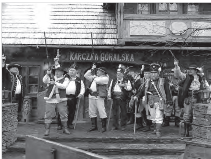
Nie taki dawny Ustron, 2014 r.