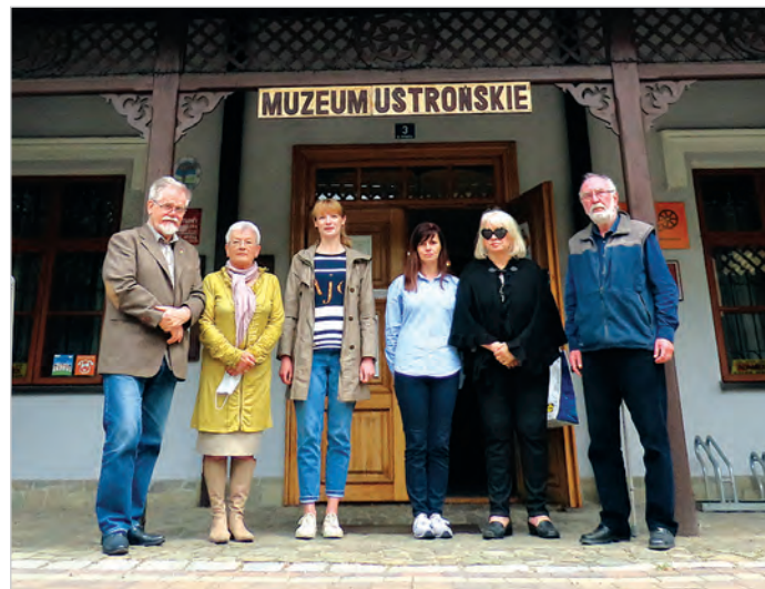
Rada Muzeum poprzedniej kadencji.