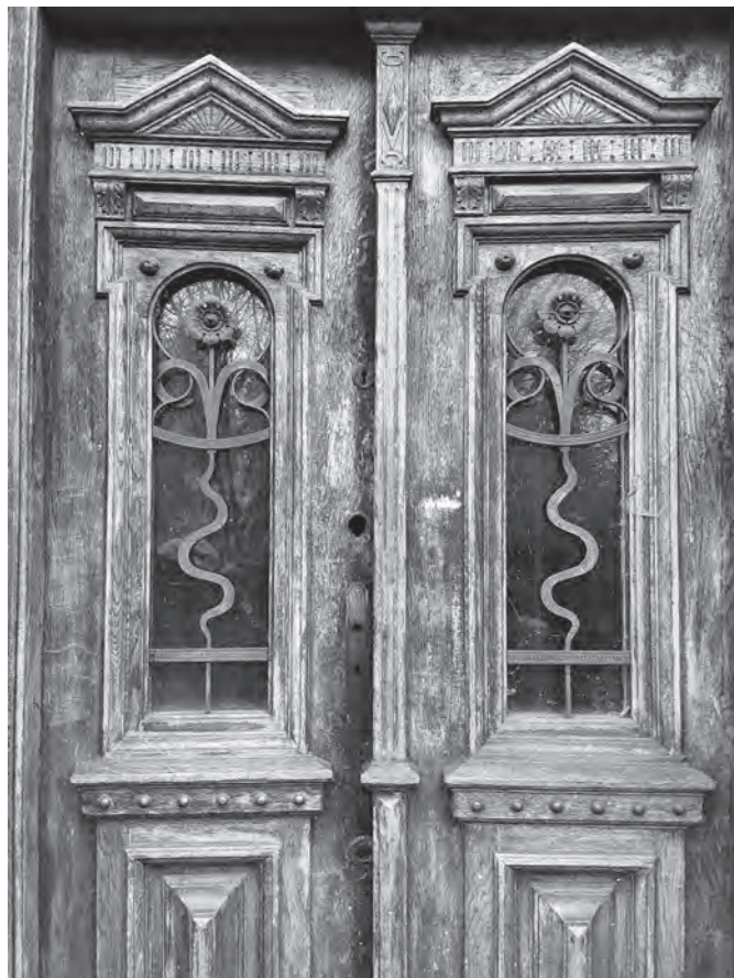
Oryginalnie zachowane drzwi wejściowe.