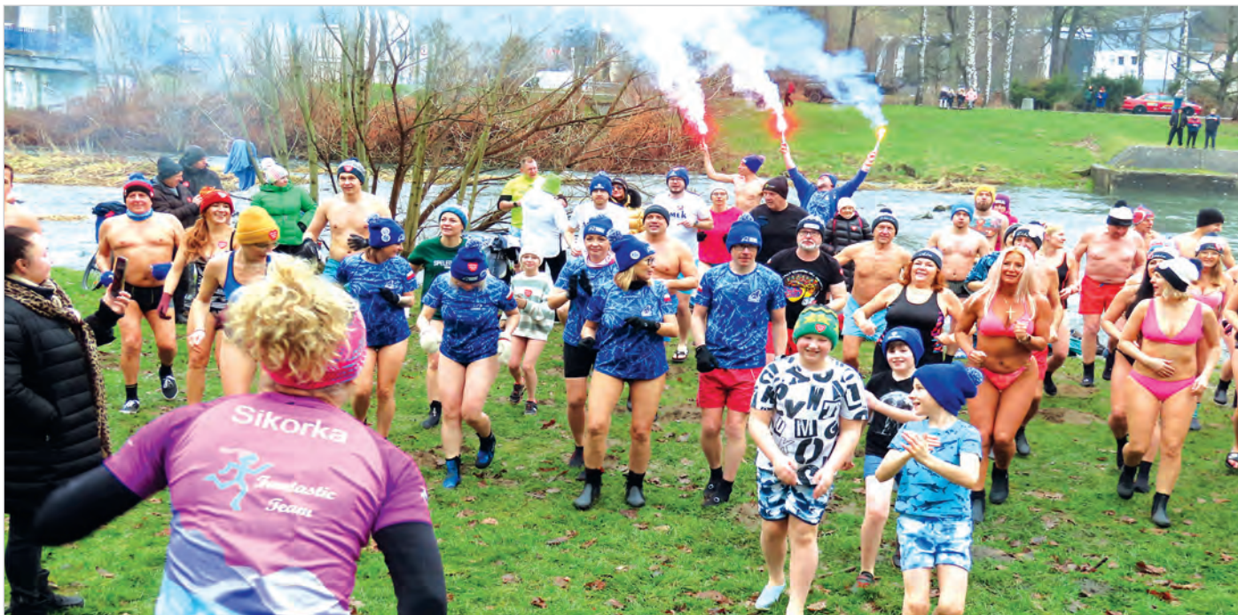
Rozgrzewka przed morsowaniem w ramach ustronkiego Finału Wielkiej Orkiestry Świątecznej Pomocy.

W numerze m.in.: Życzenia dla Jubilatów, List do redakcji, Czujki mogą ocalić życie, Relacja z sesji, Komunalna do remontu, W Dawnym Ustroniu: Wilła Blanków, Sukcesy narciarzy, Parafialny Turniej Szachowy.