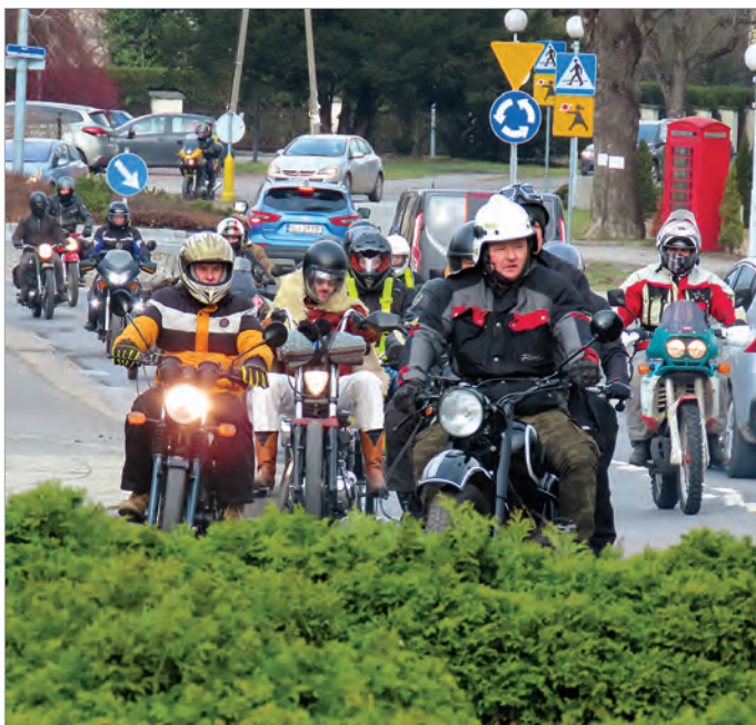
Trasa tegorocznego Zimowego wjazdu na Równice biegła od ul. Kościelnej przez 3 ronda, centrum miasta i Zawodzie.