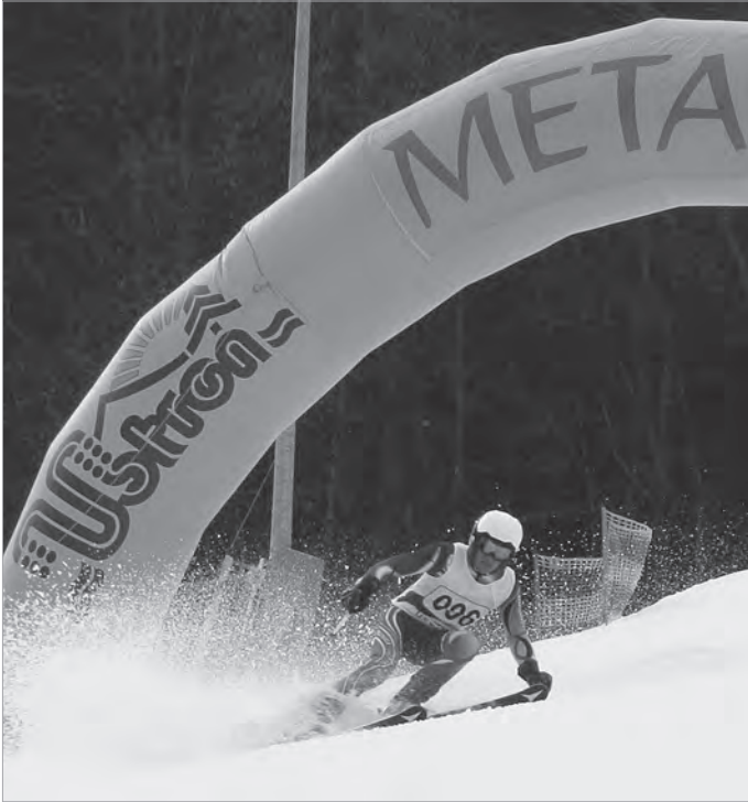
Nie taki dawny Ustroń, 2017 r.