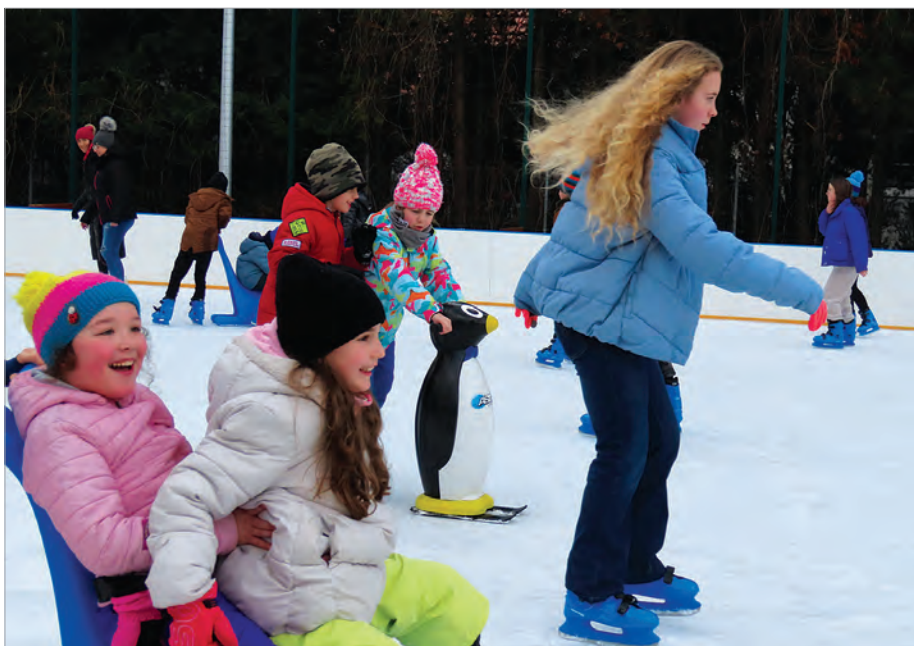
Ferie można spędzać na lodowisku.

Nr 6 (1659) • 8 lutego 2024 r. • 3,00 zł (w tym 5% Vat) • ISSN 1231-9651