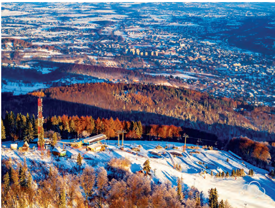
Widok na Ustron i górną stację Kolei Linowej „Czantoria”.