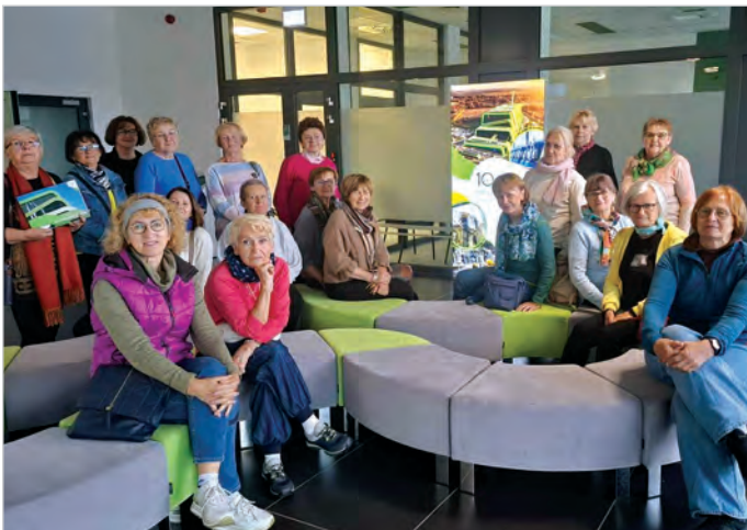
Wycieczka Uniwersytetu Trzeciego Wieku do Ekospalarni do Krakowa w ramach projektu „Drobne zmiany, wielkie przemiany”. Edukacyjnie, pogładowo krajoznawczo. Było na bogato i ani zimno, ani deszcz nam nie przeszkodził w przeżyciu fajnego czasu.