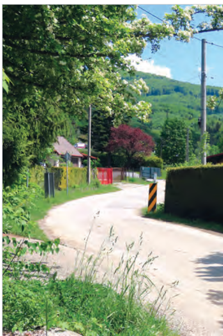
W tym miejscu doszło do wypadku.