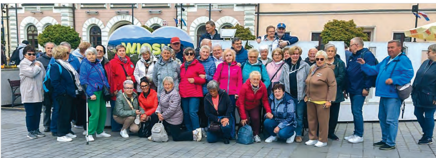
Seniorzy z ustronńskiego Koła nr 2 Związku Emerytów I Rencistów kolejną wycieczkę z cyklu „Poznaj swoją okolicę, sprawdź co się zmieniło” mają już za sobą. 13 maja zwiedzali Żywiec i okolice. Najpierw kolejką zaliczyliśmy górę Żar. Była okazja do wspomnień, nawet z Zakopanego, bo to przecież kolejka sprowadzona w 2003 r. z samej Gubałówki. Na nietypowym szczycie góry podziwialiśmy piękną dolinę rzeki Soły i pasma naszych Beskidów. Niespodzianką dla niektórych był widok zbiornika wodnego elektrowni szczytowo-pompowej pracującej w oparciu o „biały węgiel”. Dla innych zaskoczeniem był wyremontowany zbiornik, który został nieco zmodernizowany. No i kolejna atrakcja rejs statkiem Ziemia Żywiecka. Pogoda nam dopisała i w słońcu z górnego pokładu mogliśmy zobaczyć, jak to potocznie się mówi, Jezioro Żywieckie, i okolice. Nawet głębokość jeziora nie była straszna z przystojnym kapitanem Robertem na pokładzie. W końcu Żywiec - spacerkiem odwiedziliśmy najważniejsze zabytki miasta. Na rynku odbyliśmy krótkie spotkanie z burmistrzem miasta panem Szlagorem, który życzył nam miłego pobytu w mieście. Po zasłużonym obiedzie i degustacji piwa Browaru Pinta nowym odcinkiem trasy S1 przez Węgierską Górkę wróciliśmy w nasz Beskid Śląski. Na zakończenie odwiedziliśmy Gminny Ośrodek Kultury w Istebnej, gdzie oglądaliśmy największą koniakowską koronkę na świecie. Przy okazji zobaczyliśmy wiele prac twórców ludowych Trójwsi. Przed nami wyjazd na baseny i kolejna impreza tradycyjna naszych dziadków - smażenie jajecznicy w Dobce.