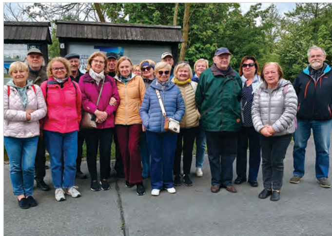
Grupa z języka czeskiego Uniwersytetu Trzeciego Wieku na wycieczce do Karwiny zwiedziła zabytkowy, krzywy kościół, spacerowała uroczym parkiem w uzdrowskiej części Karwiny w Darkovie, no i zobaczyła „morze” jako pozostałość po szkodach górniczych.