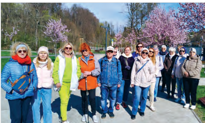
Klub Seniora odbył wycieczkę relaksacyjną do Wisły. Było po prostu wspaniale - świeże powietrze, wspólne spacerunki w beskidzkim klimacie. Serce rośnie, widząc, jak nasi seniorzy są aktywni i pełni życia.