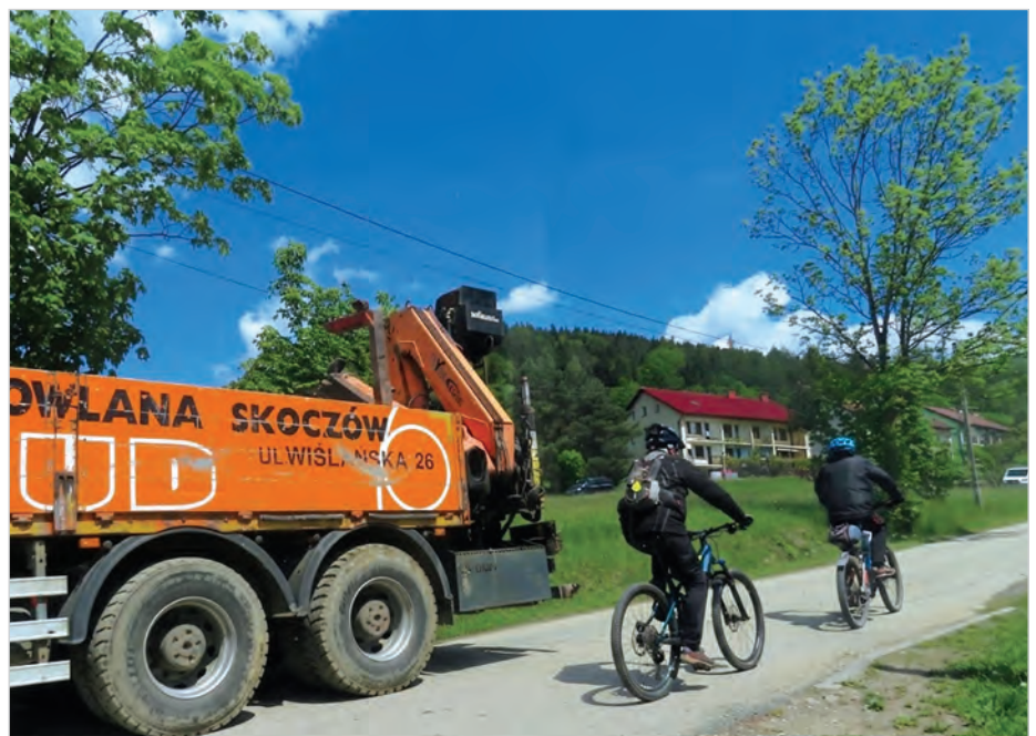
Na ul. Lecznicy panuje duży ruch, na wąskiej drodze mijają się samochody osobowe, ciężarowe, rowerzyści i spacerowicze.