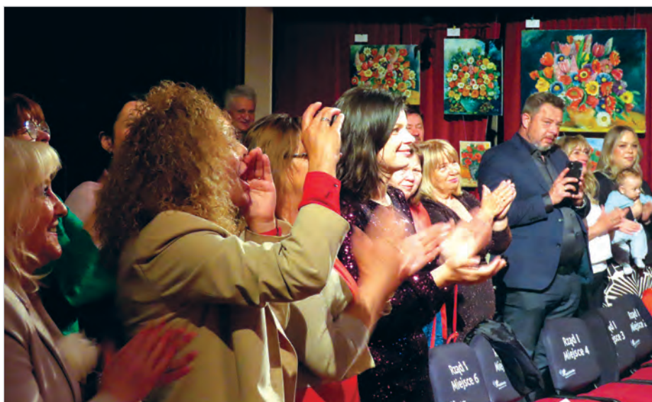
Entuzjastyczne reakcje podczas koncertu. W tle obrazy pani Ireny.