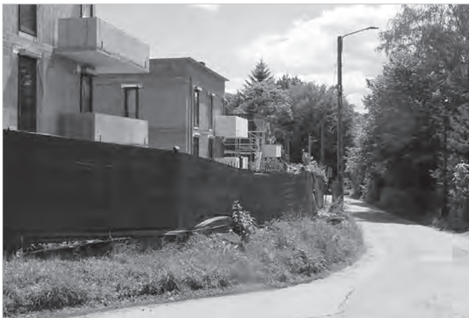
Przy wąskiej ul. Lecznicznej trwa również budowa sześciu budynków mieszkalnych jednorodzinnych w zabudowie bliźniaczej.